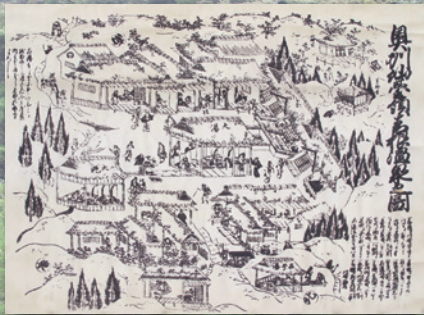
奥州仙台領青根温泉之図