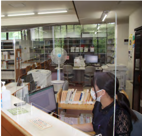
学内では感染防止のため準備が進められている(大学図書館)

5月7日の前期授業開始から全ての授業がオンラインで始まり、学生・教職員にとって手探り状態であったことは言うまでもなく、コロナ禍に翻弄された97日間でした。この期間中に私たちは新しい技術や知識を習得し、今まで不便であったものが解放されたこと も多くなりました。例えば、オンライン授業は通学の負担がありません。オンラインで始まり、学生・教職員にとって手探り状態であったことは言うまでもなく、コロナ禍に翻弄された97日間でした。この期間中に私たちは新しい技術や知識を習得し、今まで不便であったものが解放されたこと