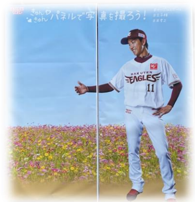
↑宮城が生んだスマイル王子 岸 孝之選手

イーグルスガールデーにはスタジアムの 様々な場所にこのようなパネルが 置かれます。自分の好きな選手と 2ショットのチャンスです！！ 選手のいろんな表情がみられるかも？