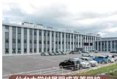
仙台大学附属明成高等学校

厚生労働大臣指定の調理師養成施設である食文化創志科のある食のスペシャリスト養成学校