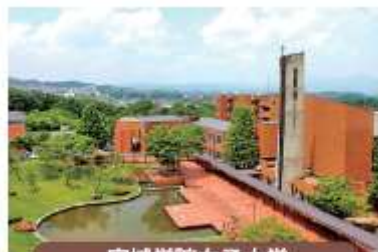
宮城学院女子大学

「愛のある知性を。」を方針に1886年に仙台市に創立された伝統校。のべ85,000名の同窓生を送り出している