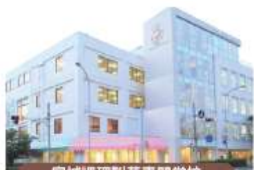
宮城調理製菓専門学校

厚生労働大臣指定の調理師養成施設である食文化創志科のある食のスペシャリスト養成学校