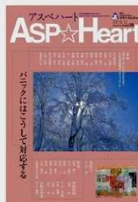
②専門誌監修「アスペハート 35号」アスペ・エルの会