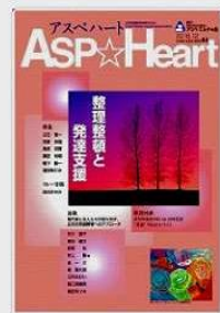
②専門誌監修「アスペハート 44号」アスペ・エルの会