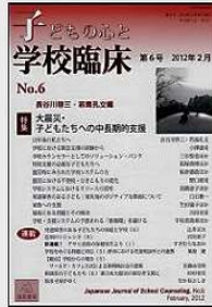
③専門誌掲載「子どもの心と学校臨床」遠見書房