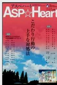
②専門誌監修「アスペハート 31号」アスペ・エルの会