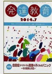
③専門誌掲載「発達教育」発達指導協会