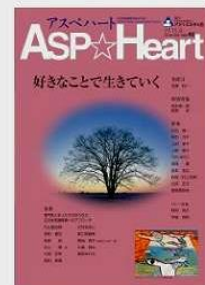
②専門誌監修「アスペハート 40号」アスペ・エルの会