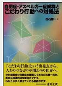
①著作(2)『自閉症・アスペルガー症候群とこだわり行動への対処法』東京書籍