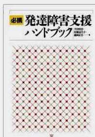
④共著(2)『必携発達障害支援ハンドブック』金剛出版