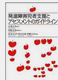
④共著(3)『発達障害者支援とアセスメントのガイドライン』金子書房