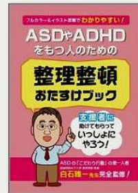
①著作(7)『ASD・ADHDをもつ人のための整理整頓おたごびック』アスペ・エルの会