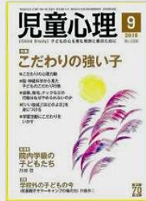
③専門誌掲載「児童心理」金子書房