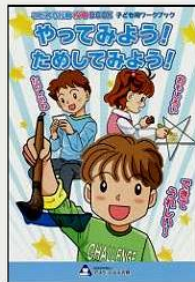
①著作(5)『こだわり行動攻略BOOK 子ども用』アスペ・エルの会