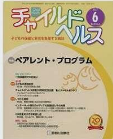
③専門誌掲載「チャイルドヘルス」診断と治療社