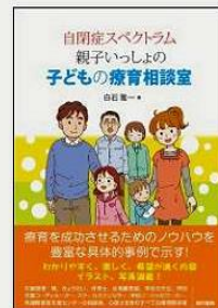
①著作(3)『自閉症スペクトラム 親子いっしょの療育相談室』東京書籍