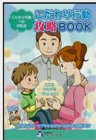
①著作(4)『こだわり行動攻略BOOK』アスペ・エルの会