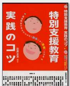
④共著(1)『特別支援教育実践のコツ』金子書房