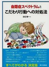
①著作(6)『自閉症スペクトラムとこだわり行動への対処法』東京書籍