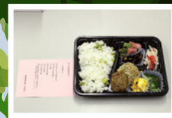
学生プロデュースお弁当例 ※2023年度のもの