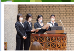
学長賞受賞者による 成果発表