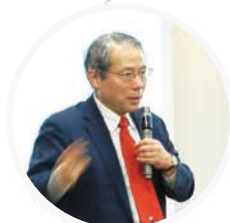
國藤 進先生 北陸先端科学技術大学院大学 名誉教授